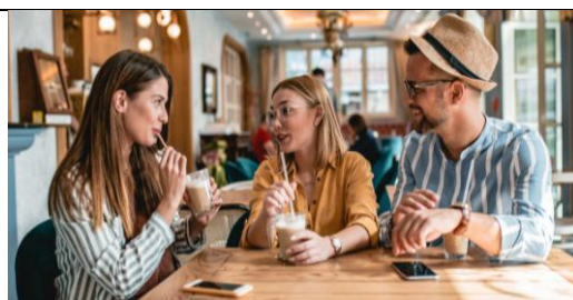
LOS HAN PEDIDO CON SU MÓVIL- CLIENTES