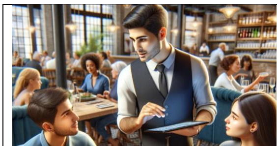
PIDE EL CAMARERO CON SU TABLET- CAMARERO